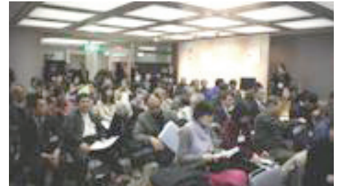
画像は以前開催したイベントの様子です